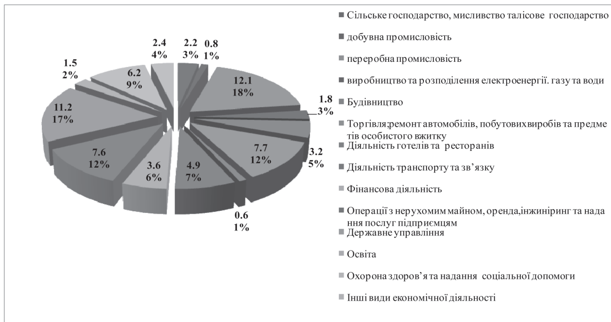
Рис.1 Потреба підприємств у працівниках за видами економічної діяльності у 2009 році

можуть знайти роботу, через те що їхні професії не затребувані на ринку праці в Україні.